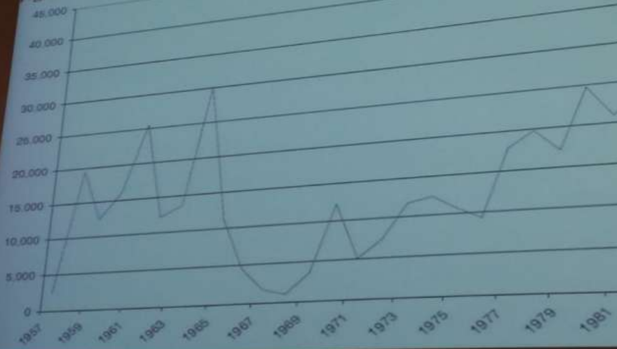
Figure 2: Romanian emigrants, 1957-1989